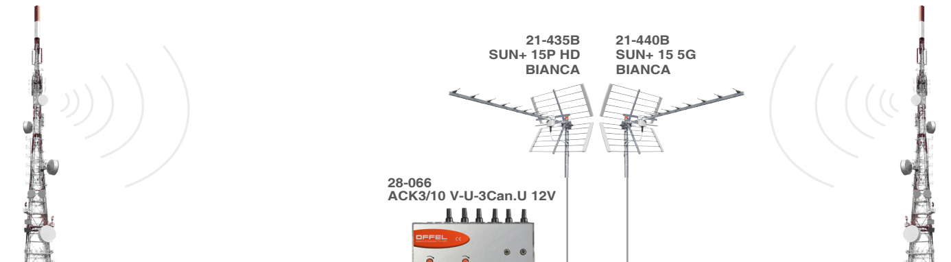
Antenne trasmettenti direzione A