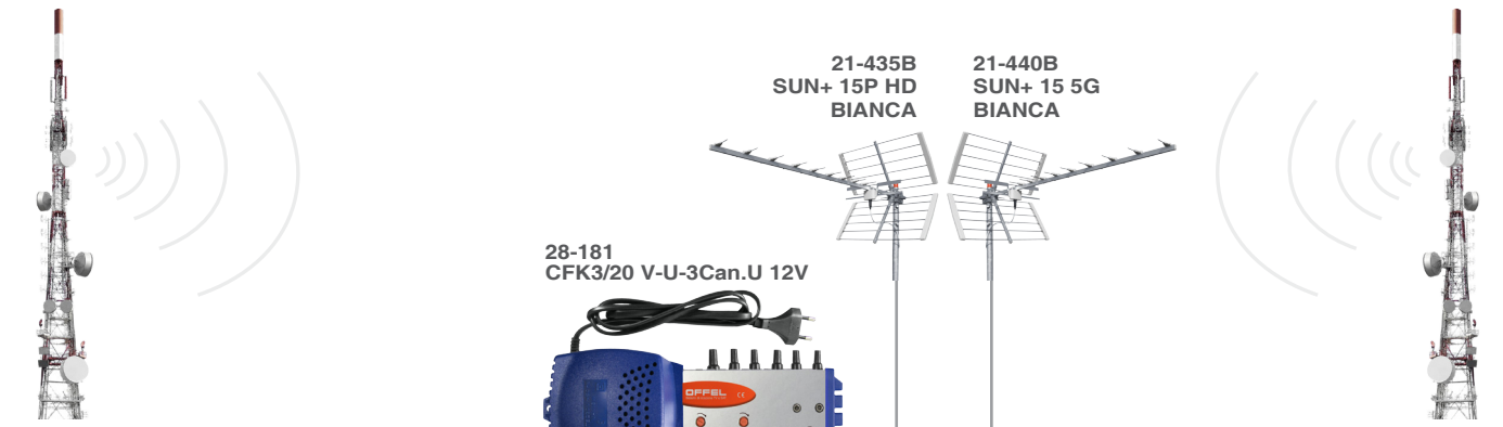
Antenne trasmettenti direzione A